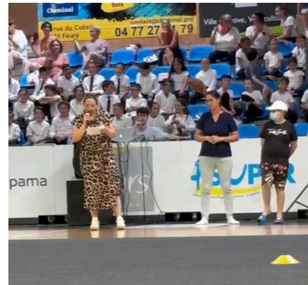
Présentation de l'association par la présidente - groupe scolaire Marcellin Champagnat - Feurs (42)