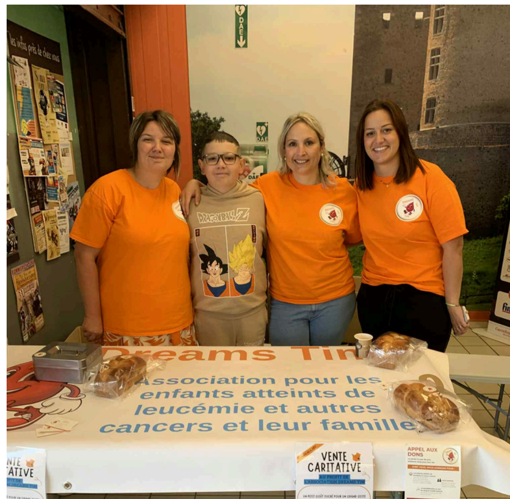
Première vente de Brioches - 2025