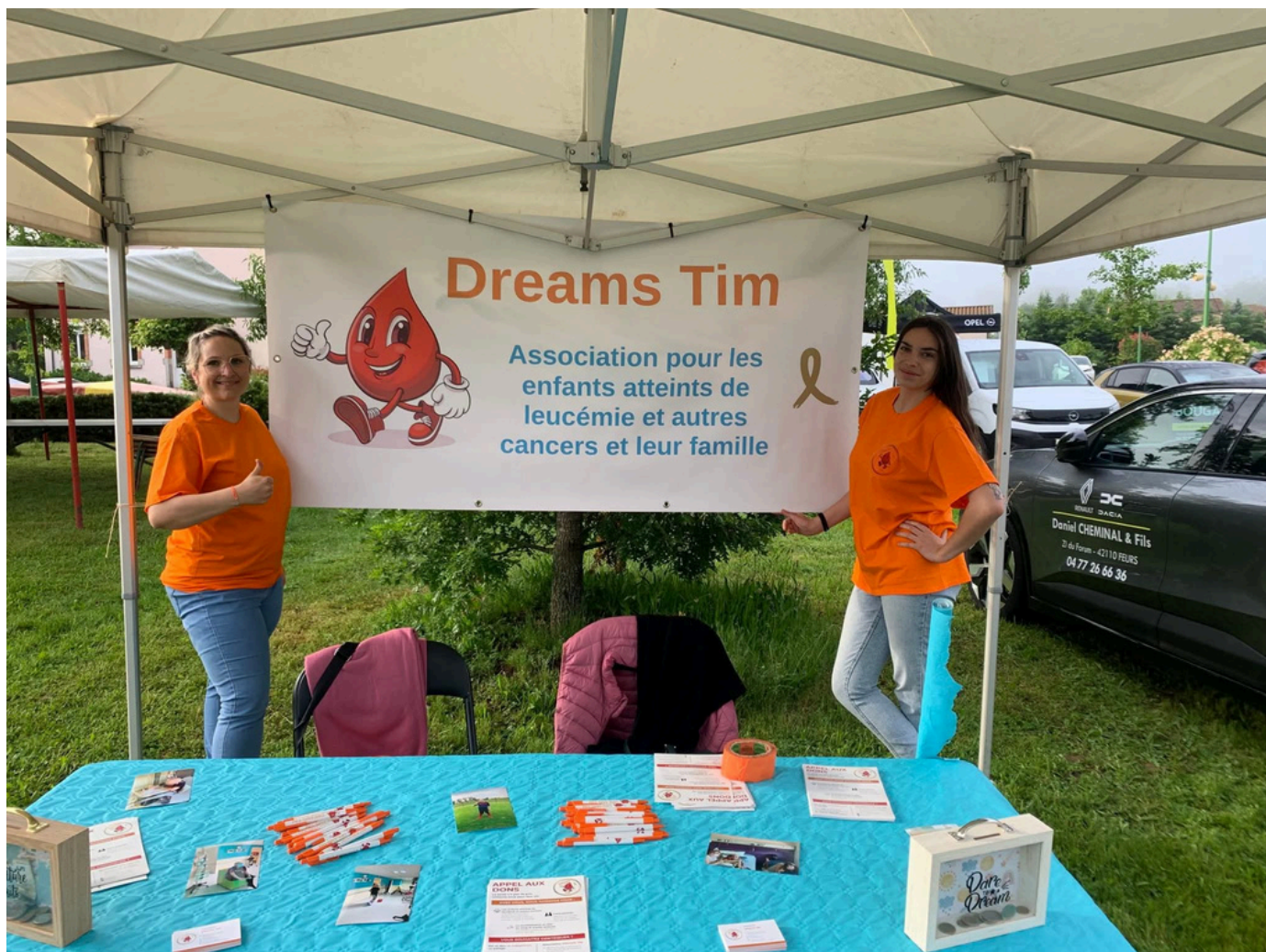
Foire aux cerises 2025 - Poncins (42)